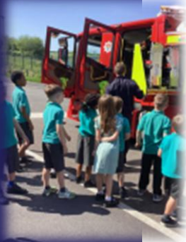
Ymweliad gan y Brigad Ddan / A Visit from the Local Fire Brigade