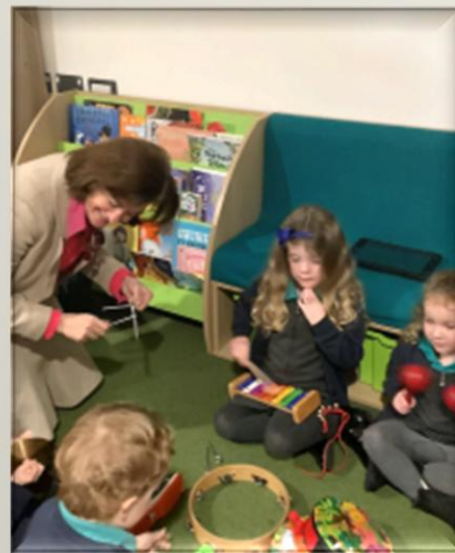
Ymweliad gan y Prif-Weinidog / A visit from the First Minister